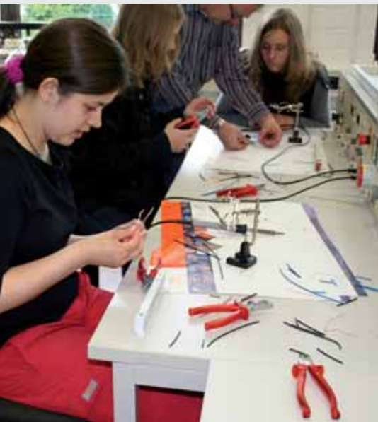
Löten und Verkabeln am Girls'Day