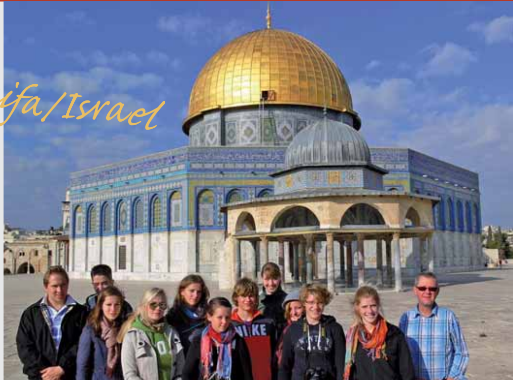
Vor dem Felsendom auf dem Tempelberg