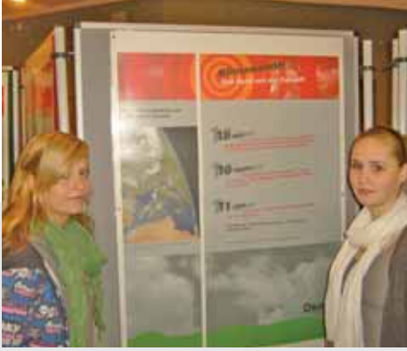
Plakatausstellung des Biologiekurs WPI Klasse 10